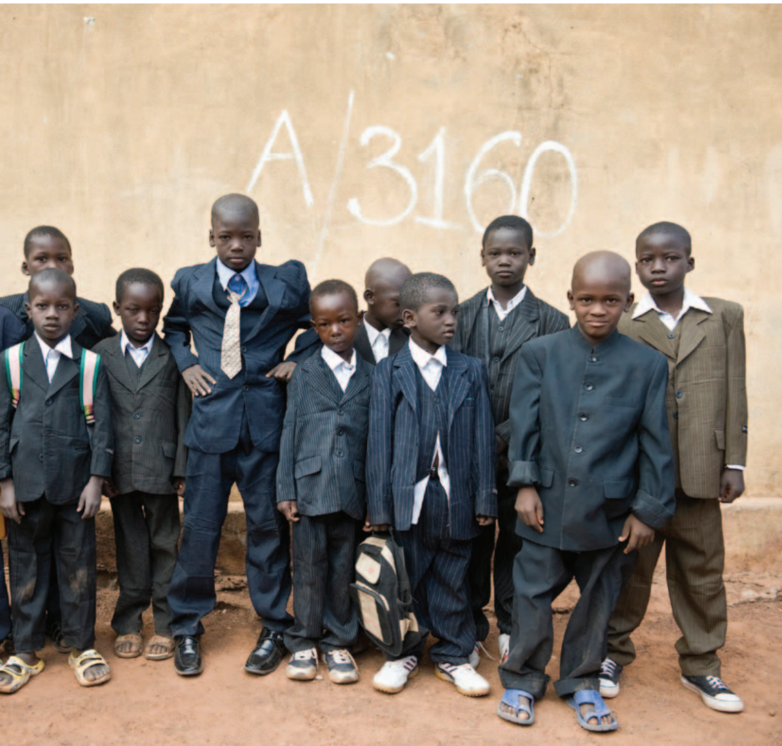
Schooljongens in hun beste pak omdat er hoog bezoek komt op hun school in Mali.