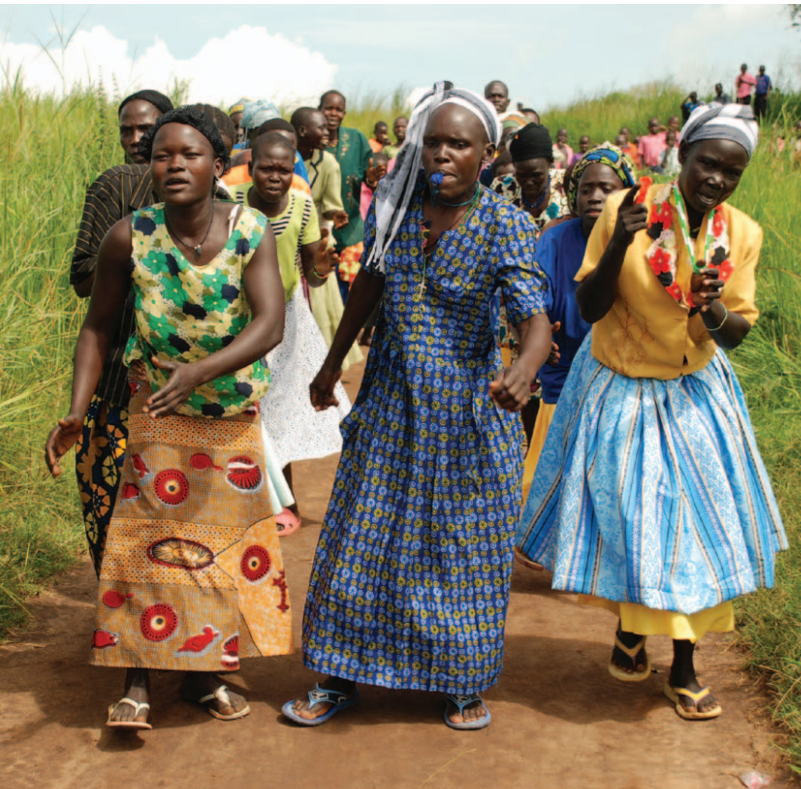
Vrouwen in Zoka Central Village in Uganda zingen