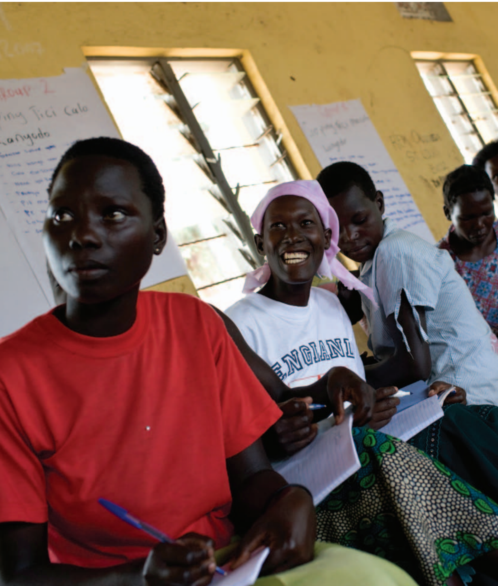
Vrouwelijke deelnemers aan een workshop van Labe in het noorden van Uganda.