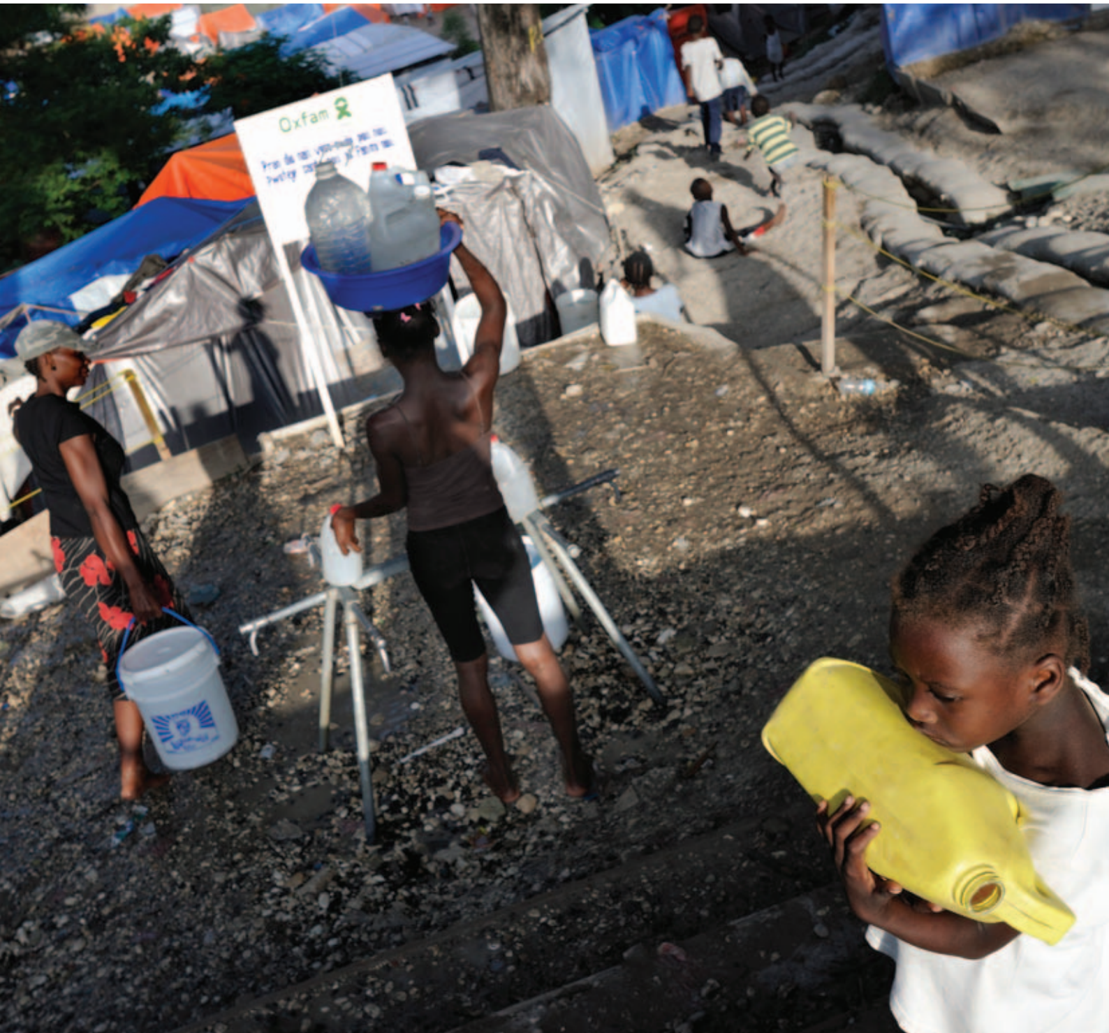
Slachtoffers van de aarbeving in Haiti halen water bij een tappunt aangelegd door Oxfam.