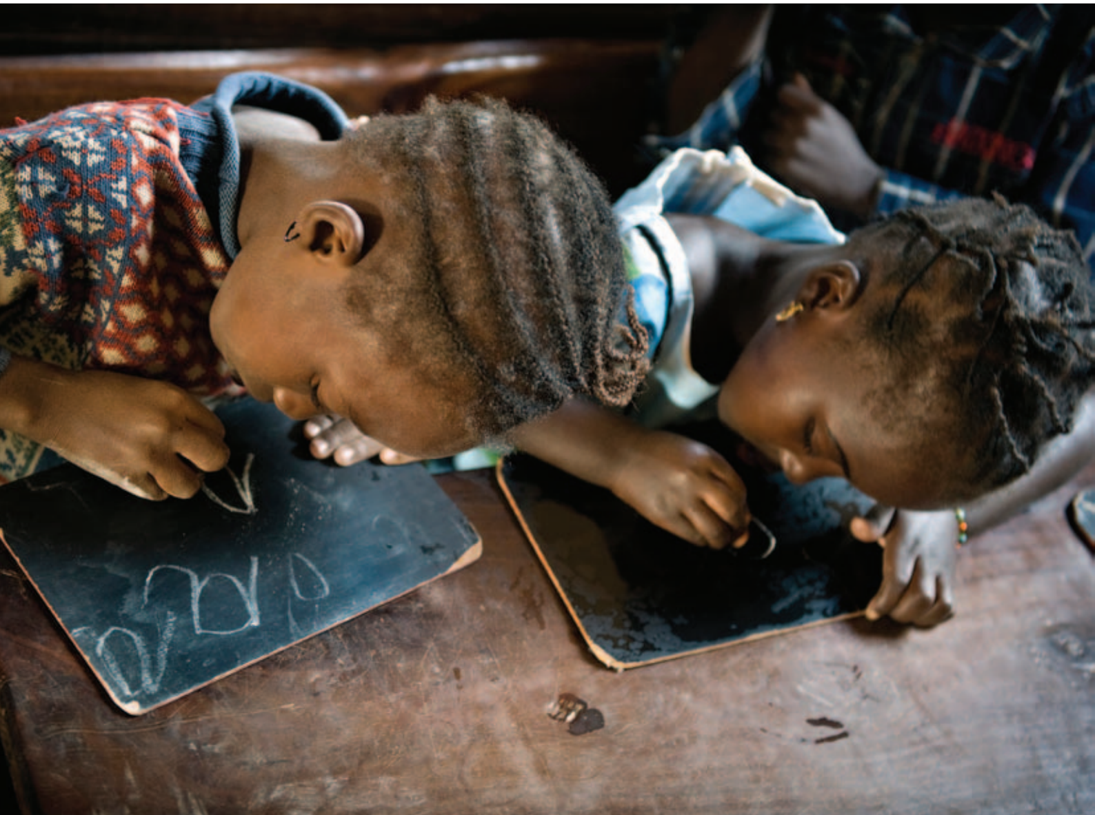
Leerlingen van een basisschool in Mali ijverig aan het werk.